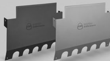
* na indywidualne zamówienie, dostępne w kolorach antracytowym lub stalowym