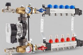
Rozdzielacze z przepływomierzami i zaworami do siłowników oraz układem mieszającym z pompą elektroniczną - seria USFP