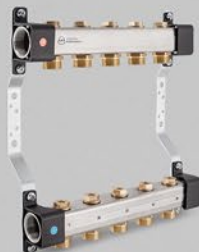
Rozdzielacze z nypłami 3/4'' i zaworami odcinającymi - seria RVV