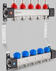
Rozdzielacze z przepływomierzami i zaworami do siłowników - seria UFS