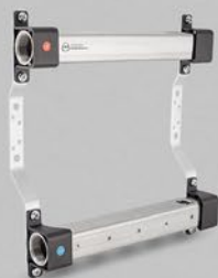
Rozdzielacze z gwintami wewnętrznymi 1/2'' - seria RBB