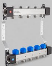
Rozdzielacze z zaworami regulacyjnymi i zaworami do siłowników - seria UVS