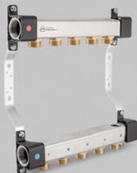
Rozdzielacze z nypłami 3/4'' - seria RNN