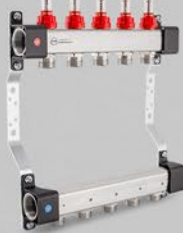
Rozdzielacze z przepływomierzami - seria UFN