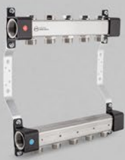
Rozdzielacze z zaworami regulacyjnymi - seria UVN