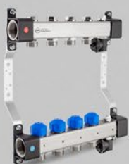
Rozdzielacze z zaworami regulacyjnymi i zaworami do siłowników oraz sekcją odpowietrzającą - seria UVST