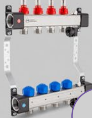
Rozdzielacze z przepływomierzami 2,5 l/min lub 5 l/min (max) i zaworami do siłowników oraz sekcją odpowietrzającą - seria UFST i UFST max