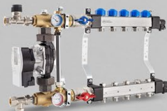
Rozdzielacze z zaworami regulacyjnymi i zaworami do siłowników oraz układem mieszającym z pompą elektroniczną - seria USVP